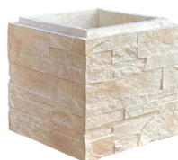
Élément boisseau PORTLAND L. 37 x l. 37 x H. 33 cm